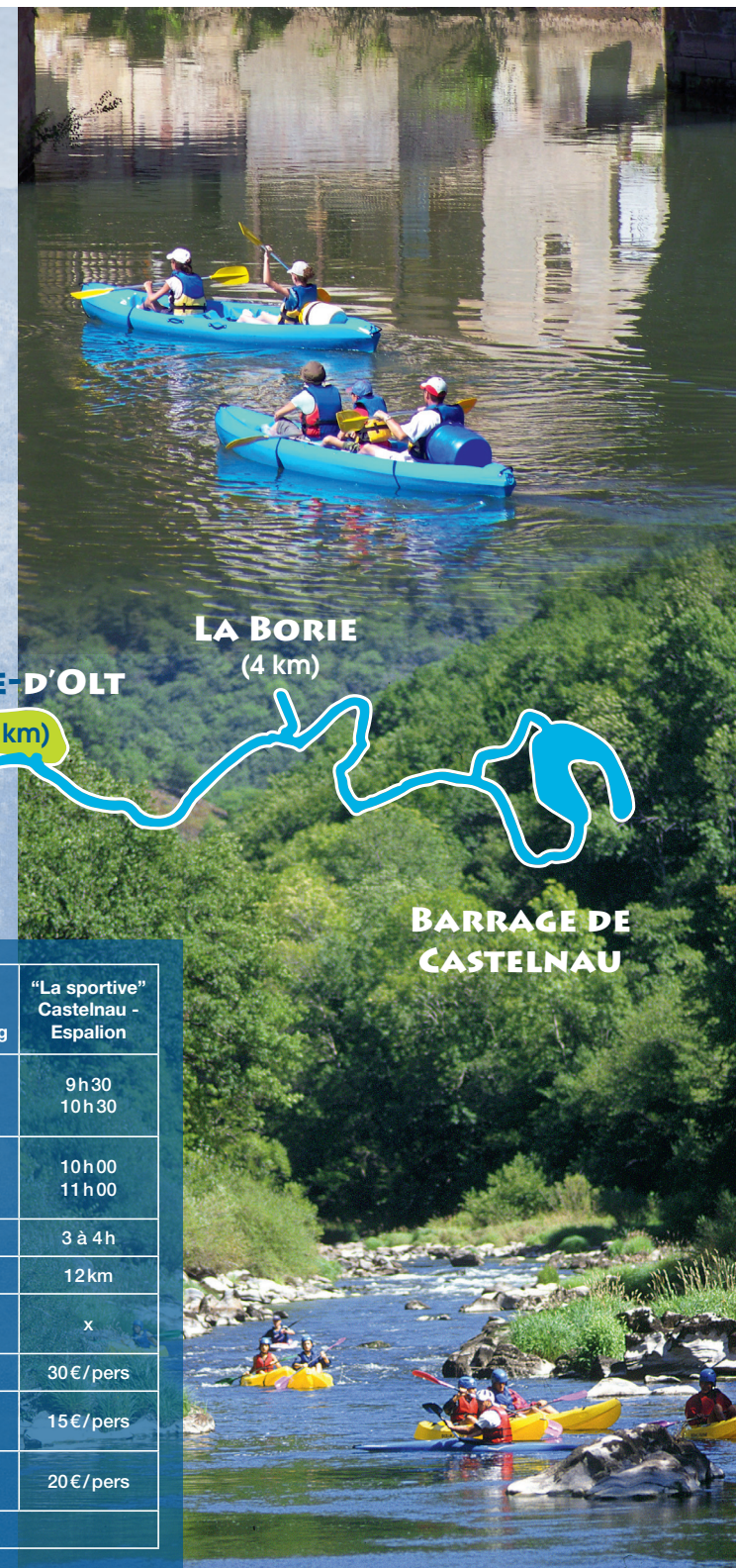
BARRAGE DE CASTELNAU

Les horaires de location sont réglés en fonction du lâcher d'eau du barrage de Castelnau pour une pratique de l'activité